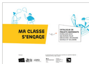
MàJ du « catalogue de projets inspirants » - projets d'éducation à l'ESS menés en établissements scolaires (PDF en ligne)