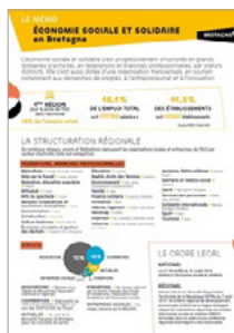
Structuration de l'ESS en Bretagne (Fiche)