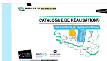
MàJ du catalogue des réalisations des structures du réemploi solidaire (PDF)