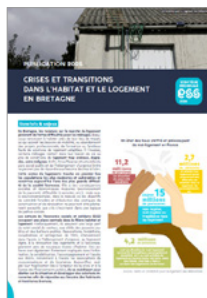
Crises et transitions dans l'habitat et le logement en Bretagne (Brochure)