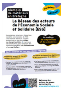
Réseau ESS breton de réemploi des matériaux (flyer)