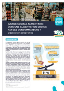
Justice sociale alimentaire : vers une alimentation choisie par les consommateurs ? (Brochure)