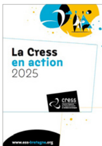
La Cress en action 2025